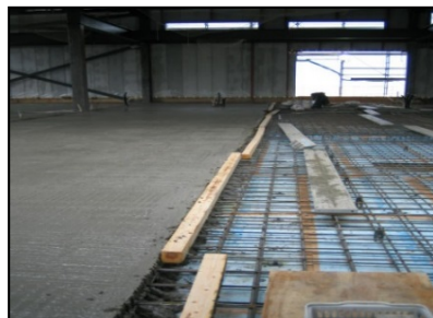
脱型 (夏季:20~30分・冬季30~40分程度)