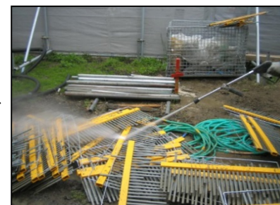
現場にて洗浄後返却下さい。