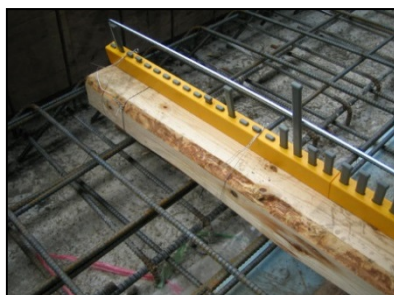
棧木にスラブフェンス極を結束線で固定