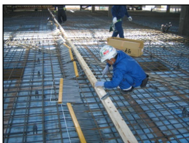
配筋に結束線を使い 固定用の棧木を固定