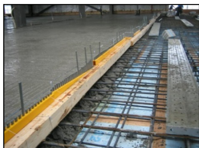
コンクリート打設